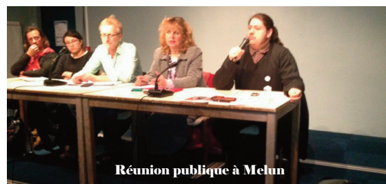
Réunion publique à Melun