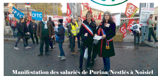
Manifestation des salariés de Purina/Nestlé à Noisiel

Matériel fin de campagne (4 pages arrivage vendredi 27 novembre (100.000 exemplaires pour la Seine et Marne)