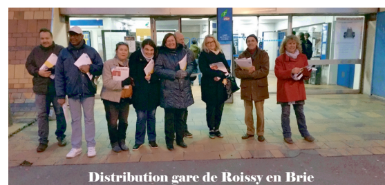
Distribution gare de Roissy en Brie