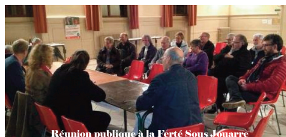
Réunion publique à la Ferté Sous Jouarre