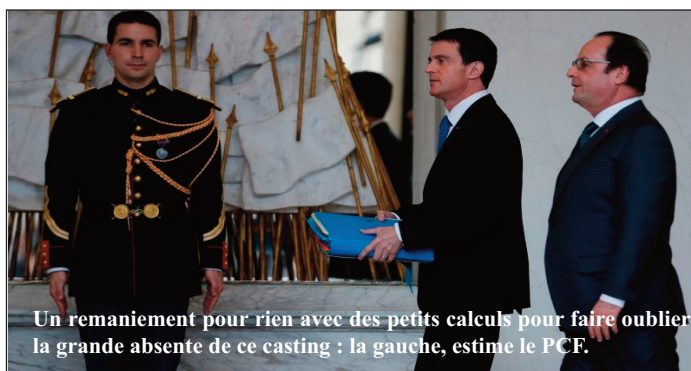
Un remaniement pour rien avec des petits calculs pour faire oublier la grande absente de ce casting : la gauche, estime le PCF.

À l'image de ce débat marqué par une levée de boucliers dans leurs propres rangs contre la déchéance de nationalité, tâtonnements et difficultés à convaincre une nouvelle "caution de gauche" s'en sont mêlés ; Martine Aubry et Nicolas Hulot ayant publiquement annoncé leur refus de venir ramer dans cette galère. Pour les rogatons de cette fin de quinquennat, Emmanuelle Cosse a pourtant accepté d'endosser une politique du logement qu'elle vilipendait il y a encore peu et de cautionner la déchéance de nationalité, donnant le coup contre EELV préparé depuis