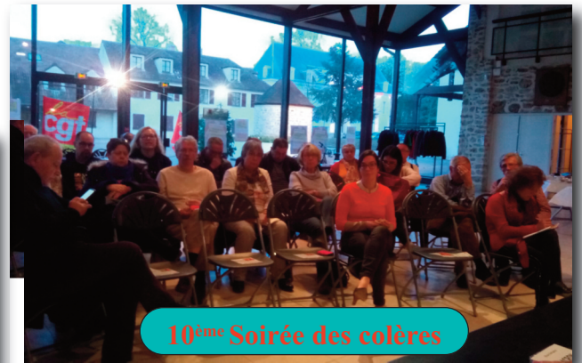
10 ème Soirée des colères