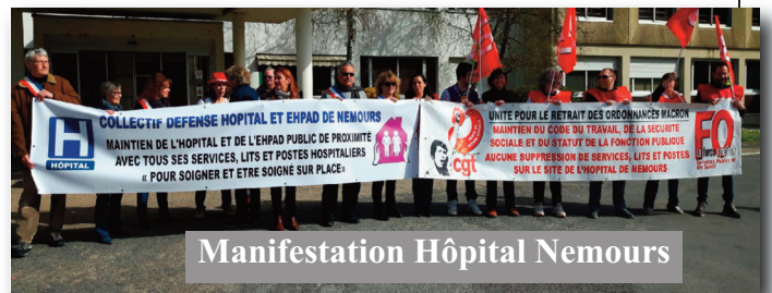
Manifestation Hôpital Nemours

fuser la fermeture de l'hôpital et l'EHPAD de Nemours. Ils s'opposent au plan de Mme Buzin ministre de la santé, réclament des moyens nécessaires pour son bon fonctionnement et son développement avec le maintien de tous les services et les lits.