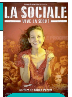
Film/Débat "La Sociale"

Contactez la fédération qui a acquis le DVD.